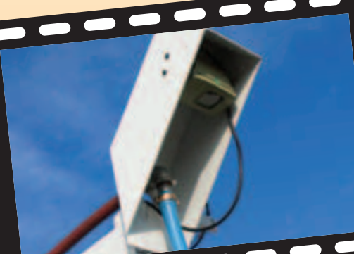
Caméra de tête de potence