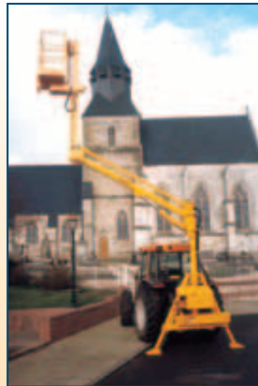
10 m (télescopique)