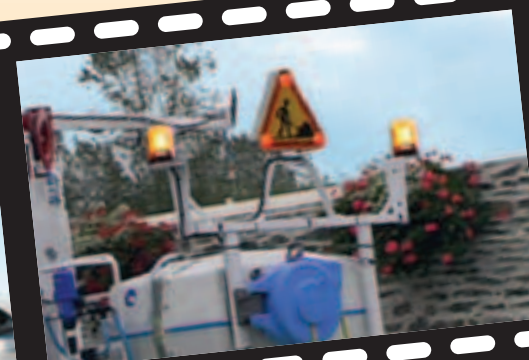
Signalisation lumineuse pour sécurité active