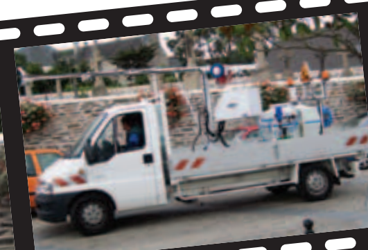
S'insère dans la circulation