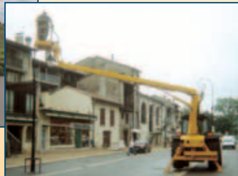
13 m (télescopique)