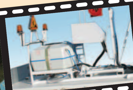
Equipement d'arrosage modulaire, complet et performant