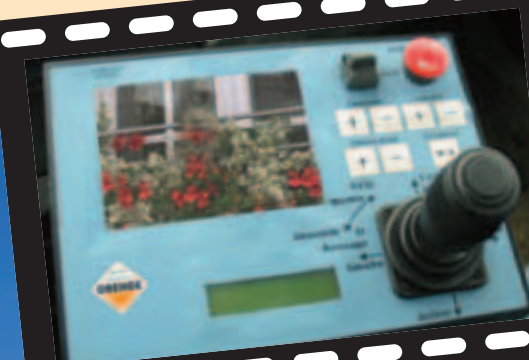
Commande et écran de contrôle