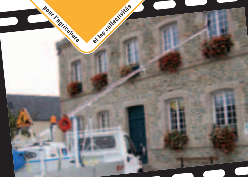
Utilisation jusqu'à 4,50 mètres